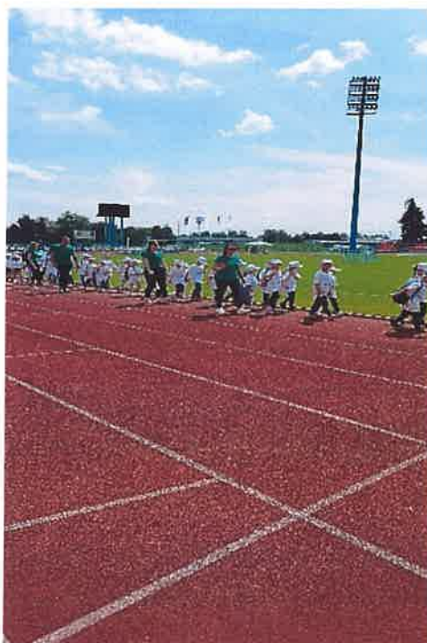
Slika 3. Otvorenje Olimpijskih igara

Starija skupina Sovići jednom tjedno bila je uključena u vrtićki projekt „Loptalica“ gdje su djeca sa školovanim kineziologom imala prilike učiti osnove nogometa, zavoljeti sport, vježbanje i zdrav način života.