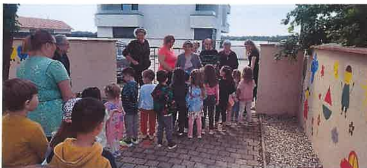
Slika 9. Odlazak u šetnju bližom okolicom sa korisnicama doma za starije i nemoćne Madona