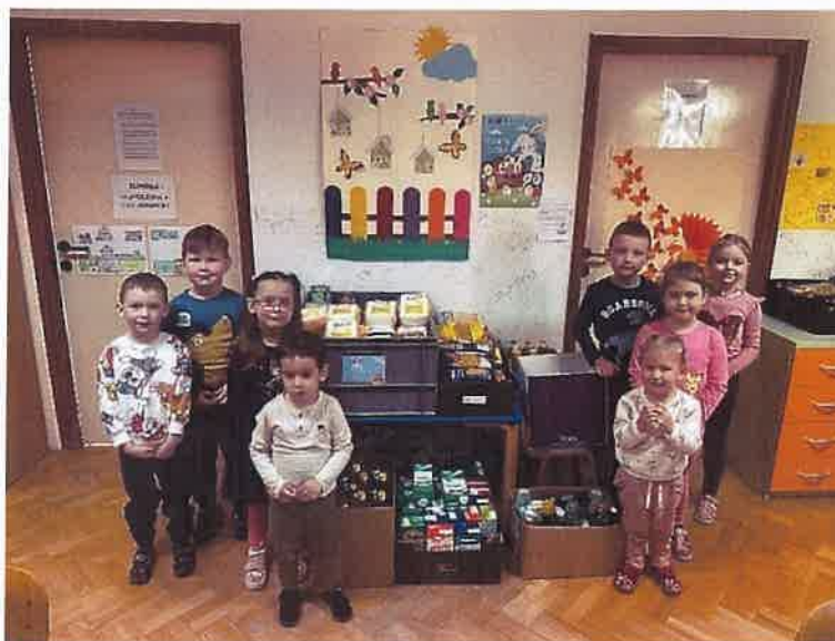
Slika 11. Humanitarna akcija “Košarica dobrote”

Dječji vrtić Jelenko je ususret Uskrsu ove pedagoške godine sudjelovao u humanitarnoj akciji Crvenog križa-Košarica dobrote. U akciji su sudjelovali roditelji/skrbnici, djeca i zaposlenici Vrtića. Svaki smo dan strugali jedno jaje, a ispod jaja nalazilo se što roditelji a i zaposlenici vrtića mogu donijeti slijedeći dan. Tako smo donosili tjesteninu, rižu, brašno, mlijeko, ulje, konzerviranu hranu, čokoladu, tvrdi sapun, šampon, pastu i četkicu za zube. Namirnice i potrepštine smo skupljali u hodniku vrtića. Odaziv je bio jako velik te smo dobili zahvalnicu za sudjelovanje, a naša akcija odnosno veliki odaziv u tako malom vrtiću bio je popraćen i u medijima na što smo izrazito ponosni.