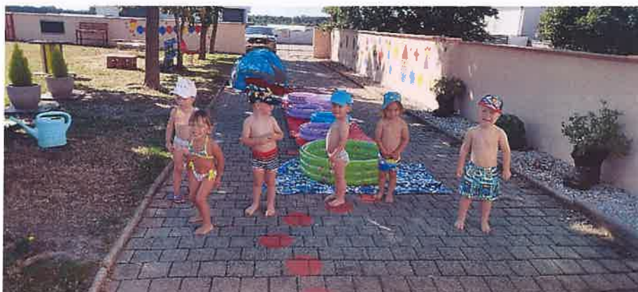
Slika 5. Jasličarci na prvom vrtićkom kupanju

Kroz cjelogodišnje aktivnosti djeca su usmjeravana na mirno rješavanje konflikata, na poštivanje pravila u zajedničkoj igri, preuzimanje odgovornosti u zajedničkoj igri, razvijao se osjećaj nesebičnosti i darivanja te voljenja prijatelja.