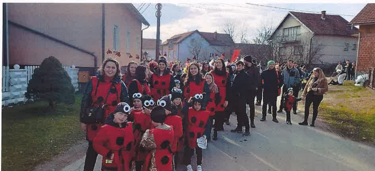
Slika 7. Sudjelovanje na maškaradi u Domašincu