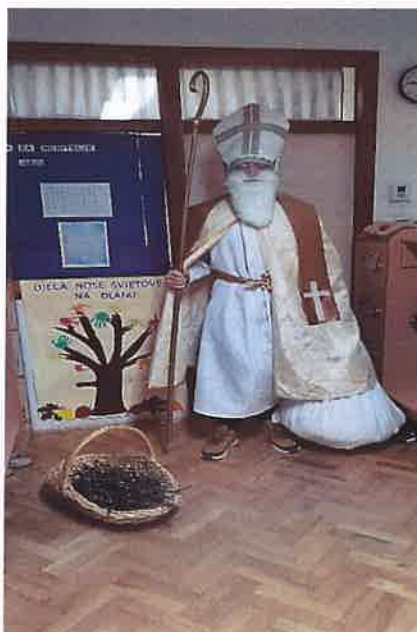
Slika 6. Sveti Nikola u našem vrtiću