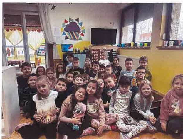
Slika 8. „Sovići“ sa knjižnim junakom kojeg su im poslali prijatelji iz Pule

Slikovnice iz paketa NMK obrađivale su se svaka posebno uz pregršt aktivnosti, koje su odgojiteljice ili same izmislile ili si potpomognule s aktivnostima navedenim u vježbenici. Svaka aktivnost bila je zanimljiva i uspješno provedena. Neke od aktivnosti bile su izrada medvjedića od slanoga tijesta, zatim izrada ključeva i učenje adrese, izrada okvira za slike, sadnja lavande. Slikovnice su bile prilagođene dječjem uzrastu, vrlo zanimljive i pune predivnih priča i ilustracija. Projekt se provodi vrlo slobodno, uz određene smjernice, bilo je vrlo zanimljivo djeci, a ono najbitnije – poticao je predčitačke vještine i čitanje među Sovićima .