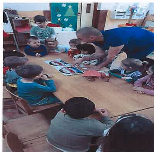
Slike 1. i 2. Radionica zdravstvenog voditelja s djecom „Kako pravilno peremo zube?“

U skladu s vremenskim uvjetima i dobi djece nastojali smo što više boraviti na zraku, ići u šetnje, realizirati razne aktivnosti i igre na dvorištu vrtića.