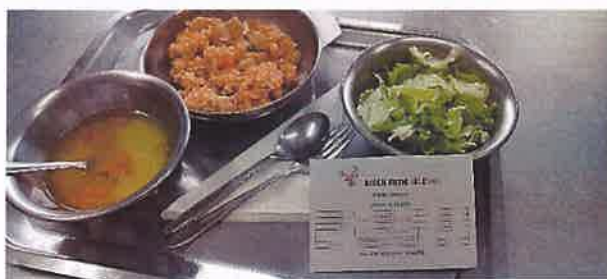
Slika 4. Primjer ručka koji je odabrala srednja mješovita skupina „Zečići“

Prehrana djece planirala se sukladno Programu zdravstvene zaštite djece, higijene i pravilne prehrane djece u dječjim vrtićima, te ostalim važećim propisima. Jelovnici su bili planirani jednom mjesečno i bili dostupni na oglasnoj ploči i web stranici Vrtića. Tijekom tjedna zdravlja kojeg smo obilježavali 31.03.-04.04.2025. u kreiranju jelovnika sudjelovala su i djeca sa svojim idejama te je tako svaka odgojno-obrazovna skupina napravila zdravi meni (zajutak, doručak, voćna užina, ručak, užina) za jedan dan.