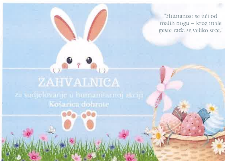
Slika 10. Zahvalnica za sudjelovanje u humanitarnoj akciji

15.05.2025. su djeca iz srednje i starije mješovite skupine sa svojim mentoricama bila pozvana na izložbu dječjih radova sa natječaja „Obiteljske vrijednosti u očima djeteta“ na koji smo se prijavili. Svojim prisustvom, podršku djeci su pružili i roditelji.